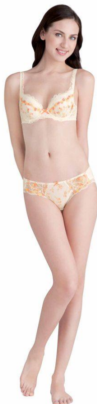
写真：『私にとけこむブラ』 BRB・486（カラー：IVパールホワイト）

※「からだと下着に関する1万人白書」調査時期：2011年2月 対象：全国25～54歳女性合計10,342名 調査方法：インターネット