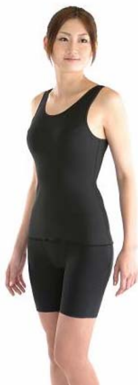
トップ = ブラキャミソール(HTY-082)・ボトム=ショーツ ロング(HSY-044)

世界初の女性によるエベレスト登頂を達成した田部井氏のアドバイスを取り入れたこの商品は、下着を着替えることが少ない登山時でも十分対応できるよう、吸汗速乾性はもちろん抗菌防臭性にもすぐれています。また、重い荷物を担いでも肌にくい込みにくい肌あたりのやさしい縫製や、男女が同室になることが多い山小屋などでも、アウターウェアを着替えるときに抵抗が少ないデザインにするなどの工夫をしています。