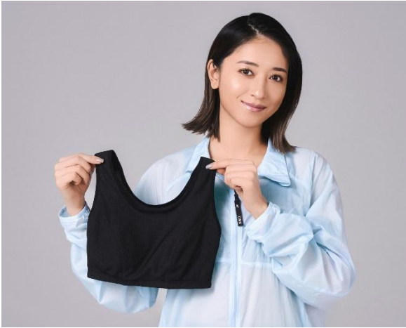
[SPORTS ゆれケア Bra Performance Up MESH] 品番：HTY138 カラー：BL アウター品番：DWR599 カラー：BU