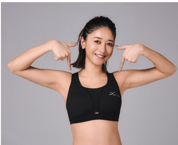
[SPORTS ゆれケア Bra Performance Up MESH] 品番：HTY178 カラー：BL