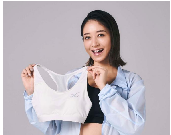
[SPORTS ゆれケア Bra «高校生対応»] 品番：HTY024 カラー：WH 着用スポーツブラ品番：HTY020 カラー：BL アウター品番：DWR599 カラー：BU