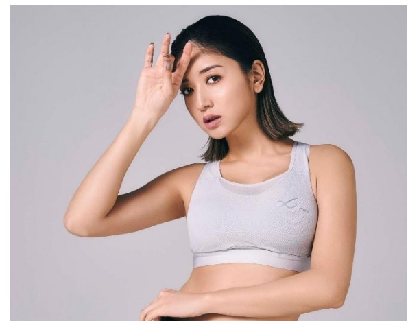
[SPORTS ゆれケア Bra MESH] 品番：HTY030 カラー：SG