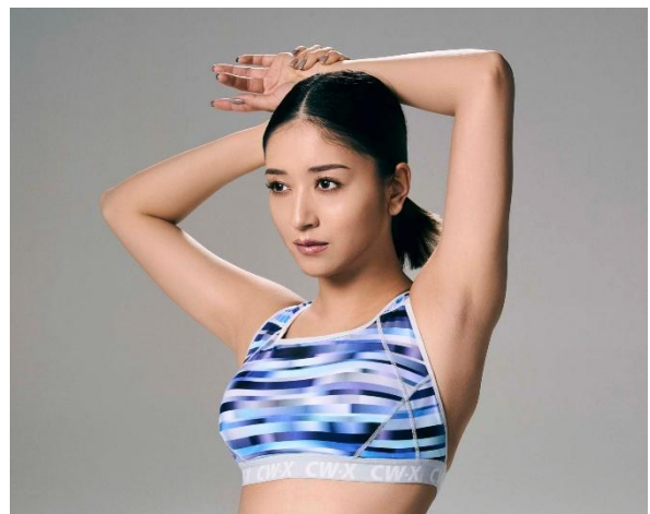
[SPORTS ゆれケア Bra Performance Up] 品番：HTY128 カラー：SX