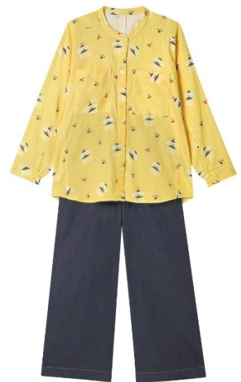
YE（イエロー）：ポムポムプリン