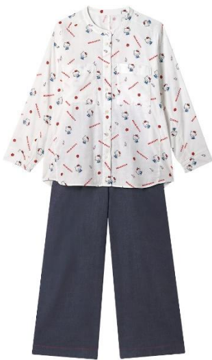
RE（レッド）：ハローキティ