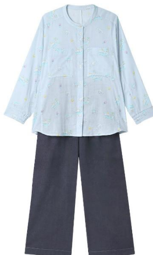
SX（サックス）：シナモロール