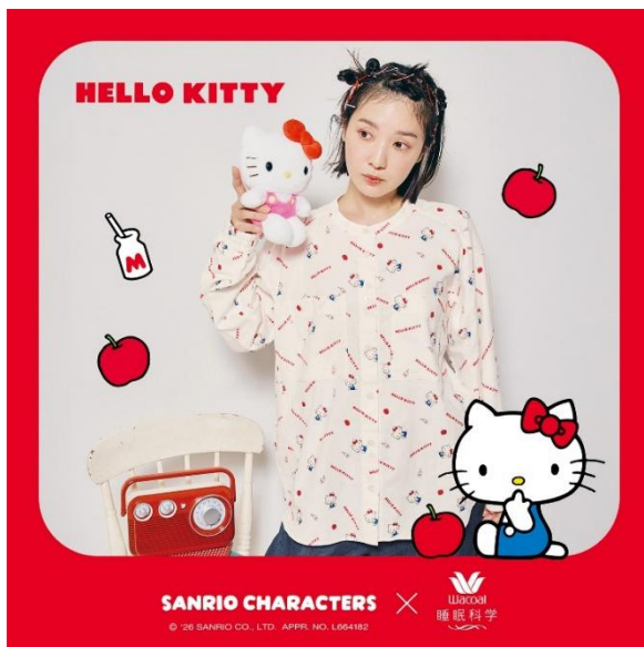
「ワコール 睡眠科学」 「寝返りしやすい立体設計パジャマ」 品番：YDX651 カラー：RE

「ワコール 睡眠科学」の「寝返りしやすい立体設計パジャマ」より 「サンリオキャラクターズ」コラボレーションデザインが新登場！