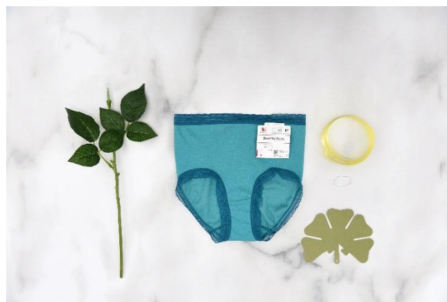
パンツフラワーキット