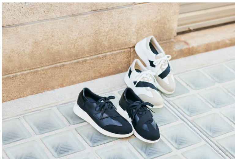
「サクセスウォーク」[ichi-ho] 品番（カラー）：WIN352（左からBL・LG）

（※1）からだの左右のブレとは、歩いているときからだが左右に揺れながら歩いている状態です。