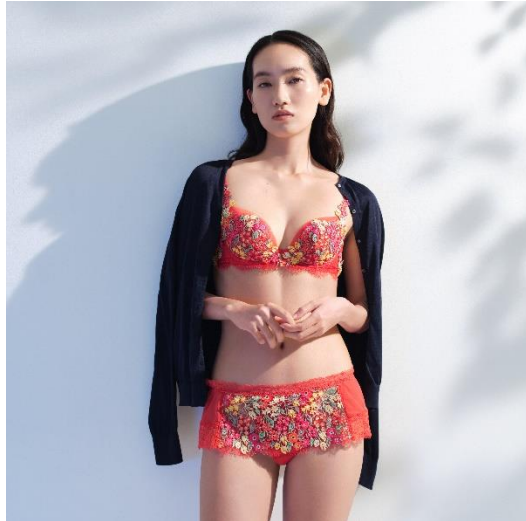
「Yue」 [71 グループ] 品番：BJP471、PJP571 カラー：OR

株式会社ワコール（本社：京都府京都市、代表取締役社長執行役員：川西啓介）が展開するブランド「Yue（ユエ）」は、“花をまとう時”をテーマにした2025年の春夏コレクションを発表。2025年2月27日（木）より全国の取扱店舗、ワコールウェブストアをはじめとするECサイトで順次発売します。