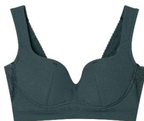
GR（フォレストグリーン）