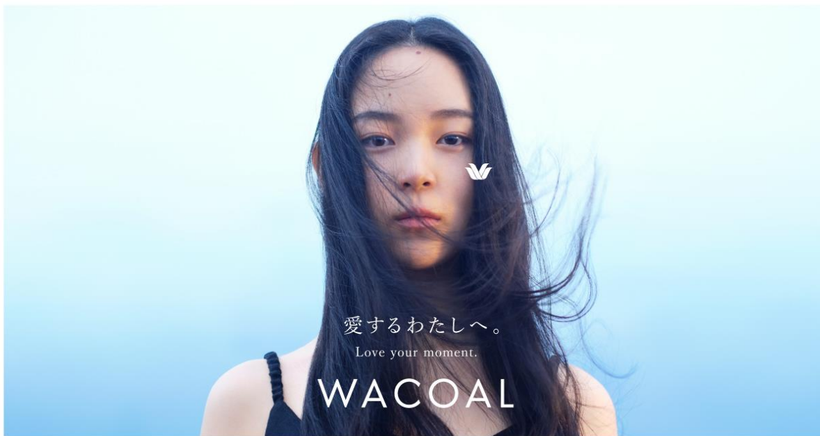
「ワコール」ブランド キービジュアル

「ワコール」ブランド公式サイト： https://www.wacoal.jp/wacoalbrand/