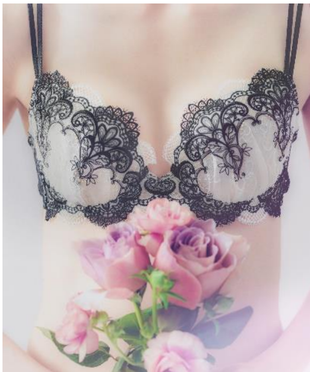
ブラジャー：BKD63（IVカラー）

(※1) n=11,952名 集計期間：2019年4月8日～2020年1月8日（先行オープン時に体験された方を含む）