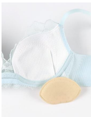
[夏めくブラ] メッシュ素材のカップ

商品ページ： https://store.wacoal.jp/dis/01_BXB485.html