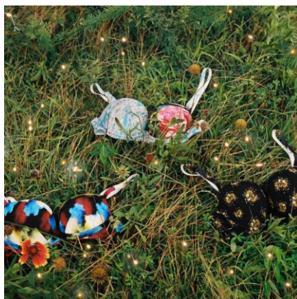
『BRAGENIC』Takako Noel × une nana cool 左：JB3832（RE） 中央：JB3833（SX） 右：JB3832（BL）

https://www.une-nana-cool.com/takakonoel/